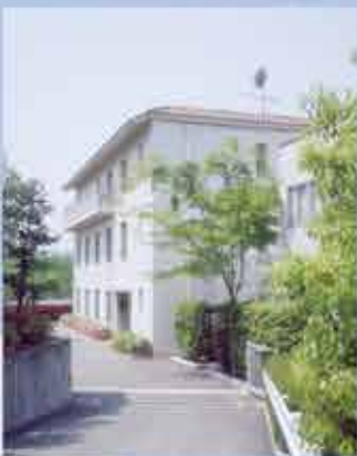
株式会社ペプチド研究所 (平成26年以前)(大阪府箕面市) Peptide Institute, Inc.(before2014)(Minoh-shi,Osaka)

Many experts of peptide synthesis were assembled in this laboratory.