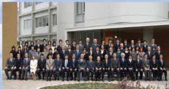
彩都研究所竣工記念(2007.1) Building Dedication Peptide Institute, Inc. SAITO Research Center(2007.1)